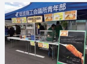
青年部はチーズドッグ、スープ販売

11月24日(日)に砺波駅前広場にて、となみの食彩ふれあい市2019が開催され、青年部では飲食ブースを出店しました。今回は、今流行の「のび~るチーズドッグ」と寒い時期に心から温まる「あったか~いコーンスープ」の販売を行いました。のび~るチーズドッグは女性に大人気で、完売することができました。当日はこの時期には珍しく気温が20度もあり、快晴の中でのイベントで大勢