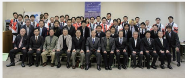
OBの皆様との集合写真