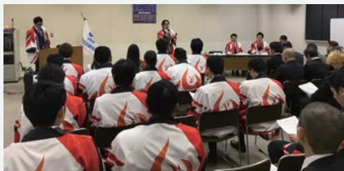
OBの皆様へ挨拶する大谷会長

結びに交流会へ多くの会員の皆さんからご協力をいただき、実行委員長として感謝致します。ありがとうございました。