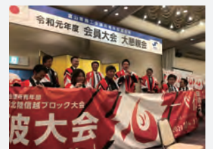
大懇親会での砺波大会 PR