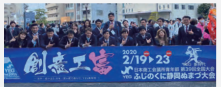
大会会場での集合写真