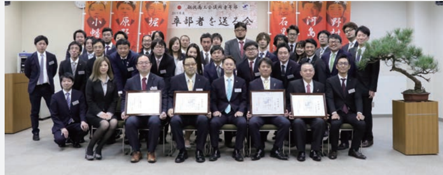
卒部者の皆様との集合写真