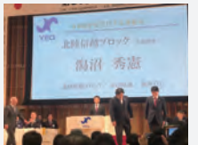
会員拡大親睦 副委員長