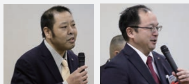
ご参加頂いた卒部者の皆さん